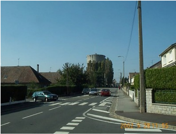
Azimut de la prise de vue : 266 gr