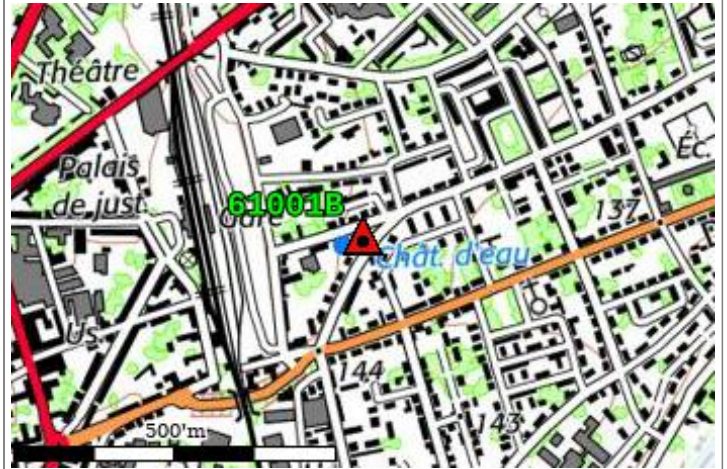
Carte : 1716 ALENCON